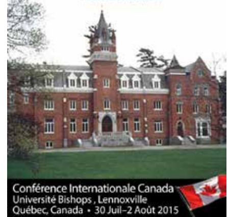
Conférence Internationale Canada Université Bishops, Lennoxville Québec, Canada - 30 Jul-2 Août 2015

Progresser de l'humain au divin Se révéler à Dieu