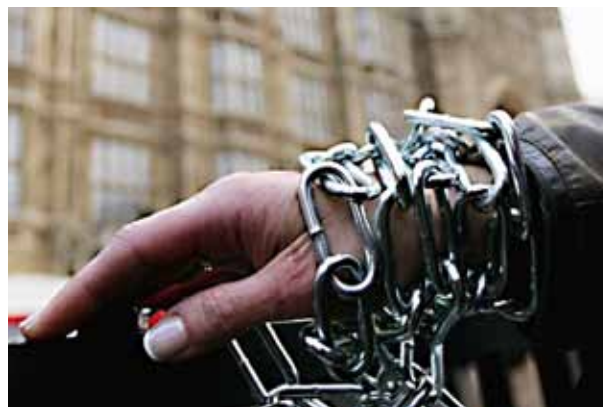
Mientras uno de nosotros esté encadenado, nadie es libre (foto)

A LO LARGO DE LOS ÚLTIMOS DIEZ AÑOS, un pequeño comité de miembros de la AUI enormemente entregados se han dedicado silenciosamente al asunto de diseminar El libro de Urantia a los que se encuentran en los lugares más profundos y oscuros: las cárceles de nuestro país. Antes de la formación de este comité, responder las cartas de los reclusos era un servicio que llevaba a cabo el equipo de la Fundación Urantia como parte de su servicio de asistencia a lectores.