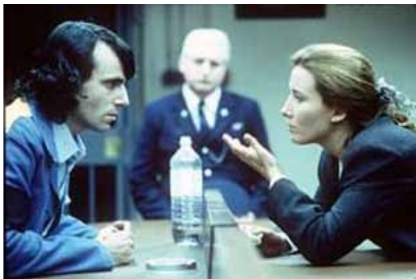
Buscar redención, recibir compasión

libro de Urantia se estaba viendo enormemente obstaculizado por la escasez de libros.