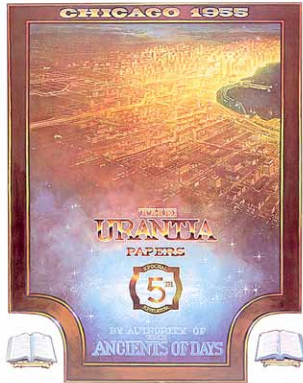
Fifth Epochal Revelation poster

Tal como fueron las cosas, la aprobación final provino de una personalidad que llegó a Urantia el 21 de agosto de 1951. Era un hijo Melquisedec desconocido hasta ese momento, de nombre Norson. Lo presentaron como el nuevo regente del príncipe planetario interino . Sabemos