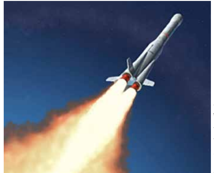
Lanzamiento de cohete (foto)

los cohetes del Webb, su misión principal es encontrar planetas. Y se encontrarán. Además, hay otra pregunta que la ciencia se plantea inevitablemente, a micrófono cerrado por así decir, en un esfuerzo tan ambicioso. Es una pregunta que el hombre espiritual plantea a su mente material, una pregunta que representa los esfuerzos realizados en la coordinación de ciencia y religión: ¿hay vida en esos planetas?.