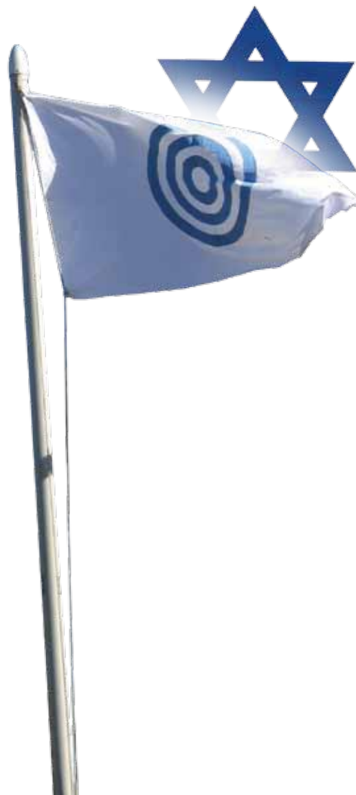
Combinación de dos símbolos poderosos (foto)

Comenzamos como dúo y ahora somos un trío. Un equipo que es tanto mínimo como completo. No me extraña que las triadas sean tan populares en el universo de universos. Los miembros de nuestro equipo se complementan mutuamente con sus habilidades y aportaciones.