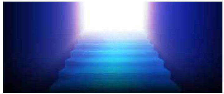
La puerta está abierta (ilustración)

Para Jesús, Judas era una aventura de la fe. El Maestro comprendió plenamente desde el principio la debilidad de este apóstol y conocía muy bien los peligros de admitirlo en la confraternidad. Pero es propio de la naturaleza de los Hijos de Dios el dar a todos los seres creados una