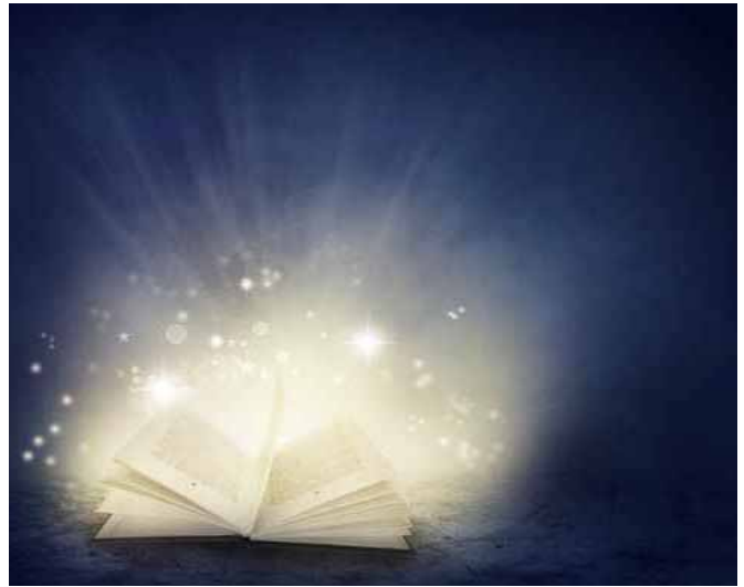
El libro de Urantia es la tercera presentación de la Trinidad a la humanidad