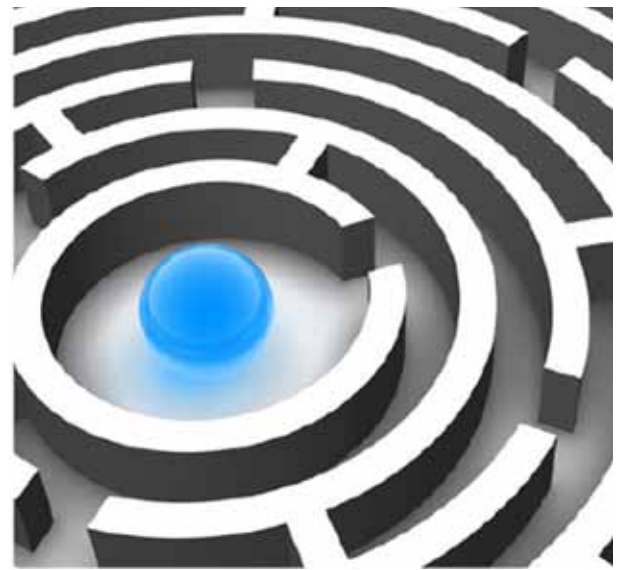
Caminos en la búsqueda del Padre (ilustración).

Así que aquí estamos, 10.000 personas religiosas de más de 80 países y 50 trayectorias de fe diferentes reunidos para este evento extraordinario, el sexto Parlamento de las Religiones del Mundo, que se celebra en Salt Lake City (Utah) durante cinco días, del 15 al 19 de octubre de 2015. El primer Parlamento que se acepta ahora que fue el primer diálogo interreligioso formal mundial se celebró en 1893 en Chicago; fue creación del juez laico swedenborgiano Charles C. Bonney. Cien años después, en 1993, más de 8.000 personas fueron a Chicago para el segundo Parlamento. En 1999, el Parlamento reunió a la gente de fe en Sudáfrica y después en Barcelona en