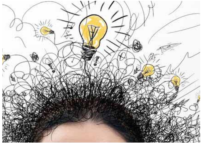
Cabeza llena de ideas (ilustración).

Y entonces noté algo en la mano. Al momento siguiente estaba en la orilla y allí, en la mano, tenía un libro.