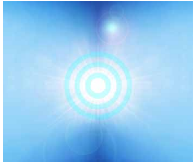
Simbolo de la Trinidad del Paraíso.

Por eso, durante el otorgamiento de Jesucristo, la mente de los judíos levantinos “ no podía conciliar el concepto trinitario con la creencia monoteísta en el Señor Único, el Dios de Israel ” [Documento 104: página 1144:5.5] con las enseñanzas que él les revelaba. La esencia de estas enseñanzas a las que me refiero era universal en su fundamento, como por ejemplo las enseñanzas del reino y del concepto de la paternidad de Dios y la hermandad del hombre. Esta última enseñanza en concreto explica los siempre presentes prejuicios del monoteísmo de hoy en día, el mismo tipo de prejuicio que tuvieron ya los apóstoles en los tiempos